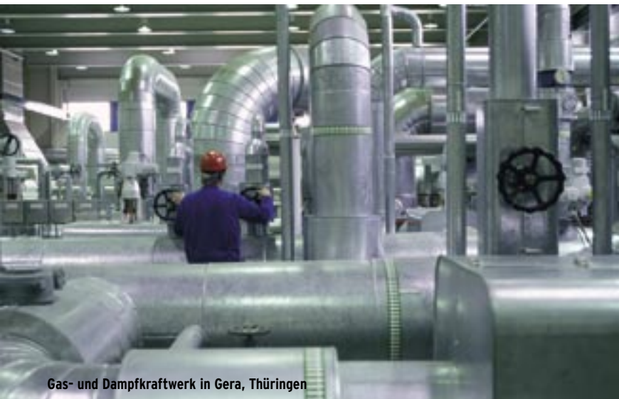
Gas- und Dampfkraftwerk in Gera, Thüringen

Das gilt auch für effiziente fossile Kraftwerke, eine weitere wichtige Säule im Energiemix der Zukunft. In den nächsten 15 Jahren muss in Deutschland die Leistung von einem Drittel aller Kraftwerke erneuert werden: 40.000 Megawatt. Hier sind modernste Technologien gefragt – erneuerbare Energien, hocheffiziente Kohle- oder Gaskraftwerke und zukünftig auch kohlendioxidfreie Gas- und Steinkohlekraftwerke. So sind auch beim Einsatz von Kohle noch gewaltige Fortschritte möglich. Gas- und Dampfkraftwerke (GuD) blasen vergleichsweise wenig Kohlendioxid ( \text{CO}_2 ) in die Atmosphäre, nutzen den Brennstoff Erdgas hocheffizient und passen aufgrund ihrer hohen Flexibilität hervorragend in ein Stromsystem mit einem hohen Anteil an erneuerbaren Energien. Gegenüber nur 35 Prozent bei Atomkraftwerken bringen es moderne Gas- und Dampfkraftwerke auf einen Wirkungsgrad von 58 Prozent. Insgesamt gibt es hier große Möglichkeiten für Innovationen und Beschäftigung, auch weil deutsche Firmen bei Gas- und Dampfkraftwerken führend auf dem Weltmarkt sind.