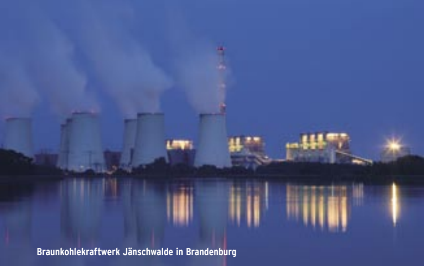
Braunkohlekraftwerk Jämschwalde in Brandenburg