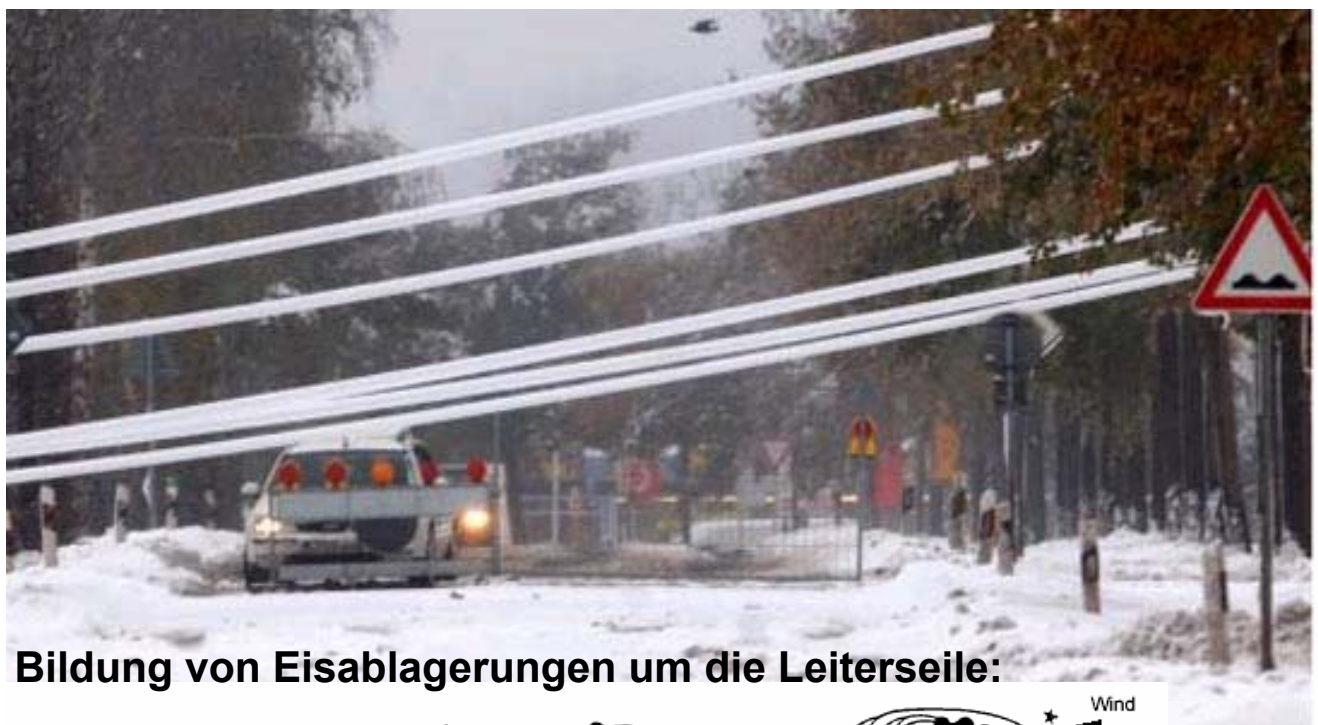
Bildung von Eisablagerungen um die Leiterseile:

ZONE 3 = sehr hohe Eislast, bedeutende Schäden in der Vergangenheit